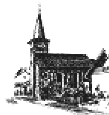
Ferialkirche St. Bonifatius Butterstadt