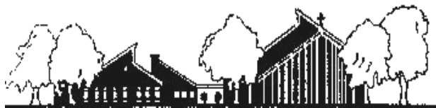
Pfarrkirche Erlöser der Welt Bruchköbel