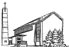
Pfarrkirche St. Familia Bruchköbel